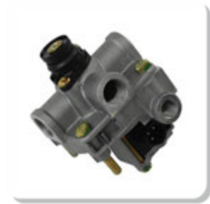
VALV. MODULADORA ABS =24V= REBOQUES MODULATING VALVE 24V ABS