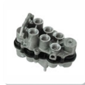
VALV. PROT. 4 CIRC. TP. AE4505 4 CIRCUITS VALVE AE4505

IVECO | EUROCARGO | NOVO STRALIS | NOVO TRAKKER | STRALIS | TECTOR | MERCEDES | 1214 | 1214K | 1218 | 1414 | 1414K | 1418 | 1418K | 1938S | 1944S | ATEGO1315 | ATEGO1418 | ATEGO1518 | ATEGO1718 | ATEGO1725 | AXOR1933 | AXOR2035 | AXOR2035 S | AXOR2040 | AXOR2040 S | AXOR2044 | AXOR2425 | AXOR2533 | AXOR2540 | AXOR2540 S | AXOR2544 | AXOR2544 S | AXOR2640 | AXOR2644 | AXOR2644 S | AXOR2825 | AXOR3340 | AXOR3340 S | AXOR3344 | AXOR4140 | AXOR4144 | L1218 | L1414 | L1418 | L1418 E | L1614 | L1618 | L1620 | L2638 | LK1214 | LK1414 | LK1618 | LK2638 | LS1625 | LS1632 | LS1633 | LS1935 | LS1938 | LS1941 | LS2638 | O500 | O500 M | O500 R | O500 RDS | O500 RS | O500 RSD | O500 U | OF1319 | OF1417 E | OF1418