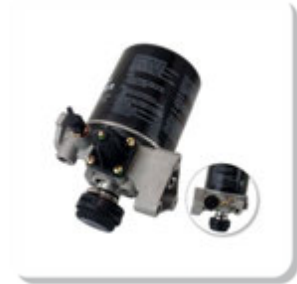
SECADOR AR =WABCO= AIR DRYER FILTER WABCO

MERCEDES | 1214K | 1215C | 1218R | 1418 | 1418EL | 1720 | 1720K | 1723 | 1723S | 1938S | 1944S | 2423B | 2423K | L1218 | L1218 EL | L1418 EL | L1418 R | L1620 | L1620R | L1622 | L1938 | L2638 | LK1218 EL | LK1418 | LK1418 APOS 96 | LK1620 APOS 96 | LK2638 | LS1632 (A PARTIR 99) | LS1632 APOS 99 | LS1938 | LS1938 APOS 98 | LS2638 | O400 | O400 RSD | OF1620 PLUS APOS 97 | OF1620PLUS (APOS 97) | OF1721 | OH1421 L | OH1621 L | OH1628 L | VOLVO | VM 260