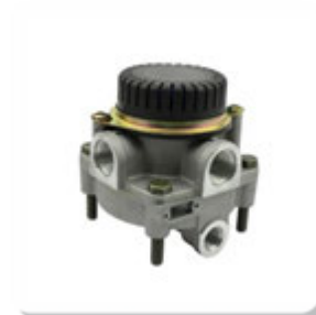
VALV. RELE TIPO KNORR VALV. RELE TIPO KNORR

IVECO | CC118 E20 GNC ONIBUS | CC118 E22 ONIBUS | CURSOR | EUROCARGO | EUROTECH | EUROTRAKKER | N.DAILY SCUDATO | NOVA DAILY | NOVO STRALIS | NOVO TRAKKER | ONIBUS 170S28 | POWERSTAR | STRALIS | TECTOR | TRAKKER | VERTIS | MERCEDES | 1214 | 1214K | 1218 | 1414 | 1414K | 1418 | 1418K | 1723 | 1944S | 2423B | 2423K | 2428 | 712 | ATEGO1315 | ATEGO1418 | ATEGO1518 | ATEGO1718 | ATEGO1725 | AXOR1933 | AXOR2035 | AXOR2040 | AXOR2044 | AXOR2425 | AXOR2533 | AXOR2540 | AXOR2544 | AXOR2640 | AXOR2644 | AXOR2825 | AXOR2828 | AXOR3340 | AXOR4140 | AXOR4144 | L1218 | L1414 | L1418 | L1418 E | L1420 | L1614 | L1618 | L1620 | L1622 | L2638 | LK1214 | LK1414 | LK1618 | LK2638 | LS1625 | LS1632 | LS1633 | LS1634