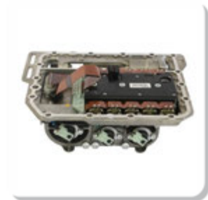
ATUADOR DO CAMBIO (WABCO) ATUADOR DO CAMBIO (WABCO)

IVECO | NOVO STRALIS | NOVO TRAKKER | MAN | TGS | TGX