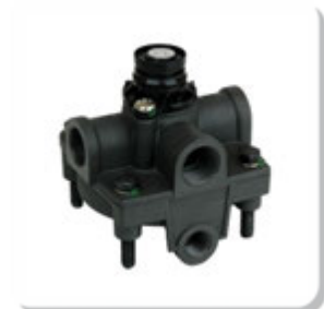
VALV. RELE (ROSCAS 3-M22 E 1- M16) RELAY VALVE THREAD M22 X M16

FORD | 1317 | 1517 | 1521 | 1717 | 1721 | 1722 | 1730 ARG. | 1731 | 2421 | 2422 | 2622 | 2626 | 2631 | 2831 | 3222 | 4031 | 4331 | 5031 | SCANIA | 114 | 124 | 164 | 94 | F112 | F113 | K112 | K113 | K114 | K124 | K94 | L113 | P.G.R. | P93 | R112 | R113 | R142 | R143 | T112 | T113 | T142 | VOLVO | B7R | FH12 | FM10 | FM12 | FM7 | VW | 13.170 | 13.170E | 13.180 | 13.180E | 13.180E CONSTELLATION | 13.190 | 15.170 | 15.170E | 15.180 | 15.180E | 15.180E CONSTELLATION | 15.190 | 15.190E | 17.180 CUMMINS EURO 3 | 17.180 MWM EURO 3 | 17. 210 | 17.210OD | 17.220 | 17.220 CUMMINS EURO 3 | 17.220 MWM EURO 3 | 17.240OT | 17. 250E | 17.250E CONSTELLATION | 17.260EOT | 17.300 | 17.310 | 17.320E CONSTELLATION | 18.310OT | 18.320EOT | 19.320E CONSTELLATION | 19.370 CONSTELLATION | 23.210 | 23.