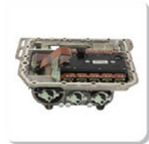
ATUADOR DO CAMBIO (WABCO) ATUADOR DO CAMBIO (WABCO)

MECO | NOVO STRALIS | NOVO TRAKKER | MAN | TGS | TGX