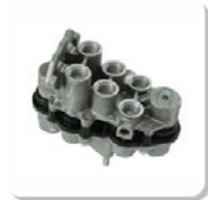
VALV. PROT. 4 CIRC. TP. AE4505 4 CIRCUITS VALVE AE4505

IVECO | EURO CARGO | NOVO STRALIS | NOVO TRAKKER | STRALIS | TECTOR | MERCEDES | 1214 | 1214K | 1218 | 1414 | 1414K | 1418 | 1418K | 1938S | 1944S | ATEGO1315 | ATEGO1418 | ATEGO1518 | ATEGO1718 | ATEGO1725 | AXOR1933 | AXOR2035 | AXOR2035 S | AXOR2040 | AXOR2040 S | AXOR2044 | AXOR2425 | AXOR2533 | AXOR2540 | AXOR2540 S | AXOR2544 | AXOR2544 S | AXOR2640 | AXOR2644 | AXOR2644 S | AXOR2825 | AXOR3340 | AXOR3340 S | AXOR3344 | AXOR4140 | AXOR4144 | L1218 | L1414 | L1418 | L1418 E | L1614 | L1618 | L1620 | L2638 | LK1214 | LK1414 | LK1618 | LK2638 | LS1625 | LS1632 | LS1633 | LS1635 | LS1935 | LS1938 | LS1941 | LS2638 | O600 | O600 M | O600 R | O600 RDS | O600 RS | O600 RSD | O600 U | OF1319 | OF1417 E | OF1418