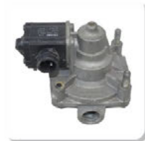
VALV. AJUSTE PRESSAO SCANIA (WABCO) VALV. AJUSTE PRESSAO SCANIA (WABCO)