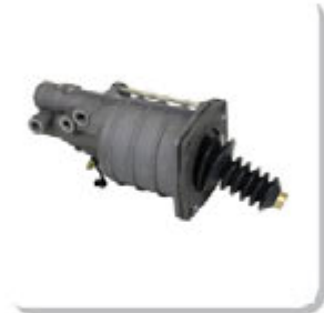
SERVO EMBREAGEM STRALIS/ CLUTCH SERVO IVECO STRALIS