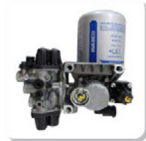
SECADOR APU WATER DRYER APU