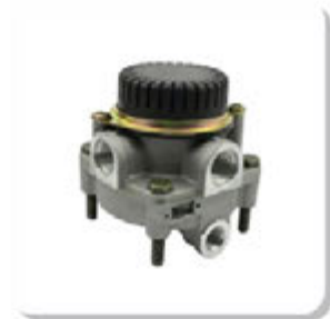
VALV. RELE TIPO KNORR VALV. RELE TIPO KNORR

IVECO | CC118 E20 GNC ONIBUS | CC118 E22 ONIBUS | CURSOR | EURO CARGO | EUROTTECH | EUROTRAKKER | N.DAILY SCUDATO | NOVA DAILY | NOVO STRALIS | NOVO TRAKKER | ONIBUS 170S28 | POWERSTAR | STRALIS | TECTOR | TRAKKER | VERTIS | MERCEDES | 1214 | 1214K | 1218 | 1414 | 1414K | 1418 | 1418K | 1723 | 1944S | 2423B | 2423K | 2428 | 712 | ATEGO1315 | ATEGO1418 | ATEGO1518 | ATEGO1718 | ATEGO1725 | AXOR1933 | AXOR2035 | AXOR2040 | AXOR2044 | AXOR2425 | AXOR2533 | AXOR2540 | AXOR2544 | AXOR2640 | AXOR2644 | AXOR2825 | AXOR2828 | AXOR3340 | AXOR4140 | AXOR4144 | L1218 | L1414 | L1418 | L1418 E | L1420 | L1614 | L1618 | L1620 | L1622 | L2638 | LK1214 | LK1414 | LK1618 | LK2638 | LS1625 | LS1632 | LS1633 | LS1634