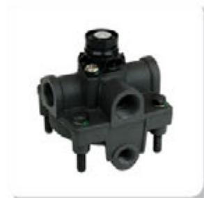
VALV. RELE (ROSCAS 3-M22 E 1- M16) RELAY VALVE THREAD M22 X M16

FORD | 1317 | 1517 | 1521 | 1717 | 1721 | 1722 | 1730 ARG. | 1731 | 2421 | 2422 | 2622 | 2626 | 2631 | 2631 | 3222 | 4031 | 4331 | 5031 | SCANIA | 114 | 124 | 164 | 94 | F112 | F113 | K112 | K113 | K114 | K124 | K94 | L113 | P.G.R. | P93 | R112 | R113 | R142 | R143 | T112 | T113 | T142 | VOLVO | B7R | FH12 | FM10 | FM12 | FM7 | VW | 13.170 | 13.170E | 13.180 | 13.180E | 13.180E CONSTELLATION | 13.190 | 15.170 | 15.170E | 15.180 | 15.180E | 15.180E CONSTELLATION | 15.190 | 15.190E | 17.180 CUMMINS EURO 3 | 17.180 MWM EURO 3 | 17. 210 | 17.2100D | 17.220 | 17.220 CUMMINS EURO 3 | 17.220 MWM EURO 3 | 17.2400T | 17. 250E | 17.250E CONSTELLATION | 17.260EOT | 17.300 | 17.310 | 17.320E CONSTELLATION | 18.3100T | 18.320EOT | 19.320E CONSTELLATION | 19.370 CONSTELLATION | 23.210 | 23.