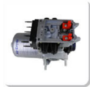
SECADOR AR COMPLETO P.G.R.T. S/ PLACA ELETRONICA AIR DRYER COMPLETE P.G.R.T.

MERCEDES | ATEGO | ATRON | AXOR | SCANIA | 114 | 124 | 164 | 94 | F/K/N ONIBUS | F94 | K114 | K124 | K94 | P.G.R.