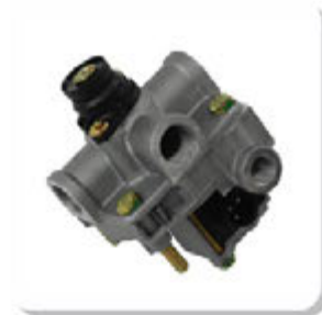
VALV. MODULADORA ABS =24V= REBOQUES MODULATING VALVE 24V ABS