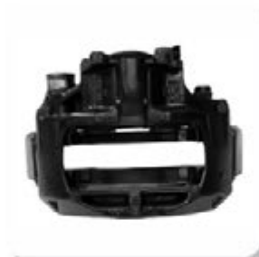
CALIPER - FREIO A DISCO BRAKE DISC CALIPER