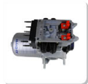
SECADOR AR COMPLETO P.G.R.T. S/ PLACA ELETRONICA AIR DRYER COMPLETE P.G.R.T.

SCANIA | 114 | 124 | 164 | 94 | F/K/N ONIBUS | F94 | K114 | K124 | K94 | P.G.R.