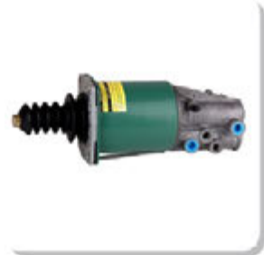
SERVO EMBR. N STRALIS/ N. TRAKKER 3 ROSCAS KNORR CLUTCH SERVO IVECO STRALIS KNORR